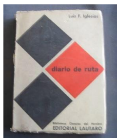
Fotografía de la tapa del libro "Diario de ruta" del pedagogo Luis F. Iglesias